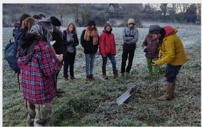
2 Mars Etude pédologique de l'ENF « Espace Naturel du Friquet » par la MFR « Maison Familiale Rurale » de Coqueréaumont