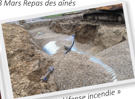
Citerne « défense incendie » rue des Bernaches