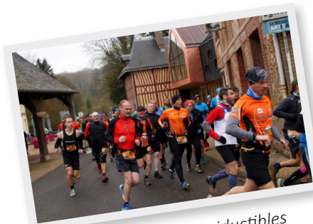
5 Mars Trail des Irauductibles