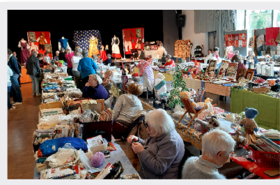
15 et 16 Avril Puces couturières et loisirs créatifs