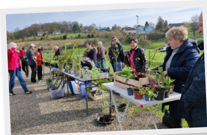
16 Avril Troc plantes