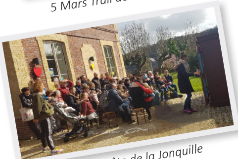
19 Mars Fête de la Jonquille