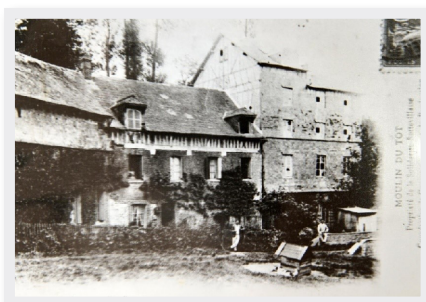
Moulin du Tôt

Pour en savoir plus, scannez avec votre smartphone