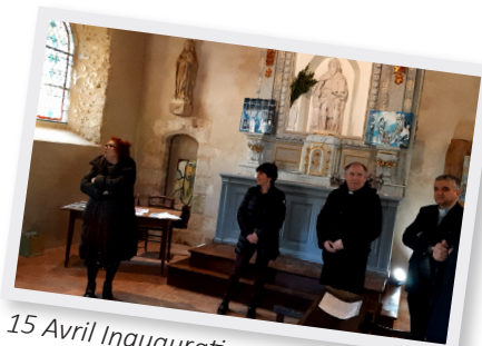
15 Avril Inauguration expo peinture à la chapelle du Tô