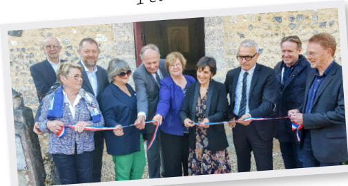
8 Avril Inauguration Chapelle du Tô