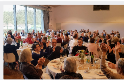
18 Mars Repas des aînés