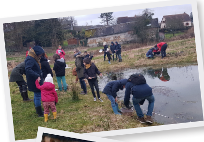
4 Mars Animation « la vie secrète des mares » à l'ENF par MFR