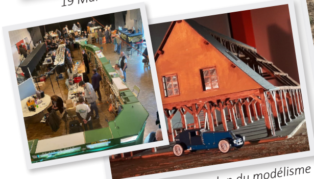
1 et 2 Avril 1er Salon du modélisme