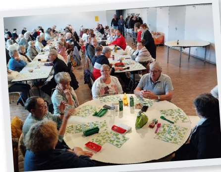
10 Novembre Loto des aînés