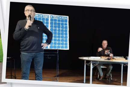
20 Octobre Loto des anciens combattants