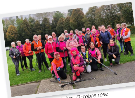
18 Octobre Octobre rose