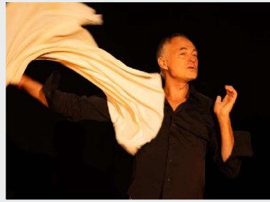
11 Octobre Festival de contes de Fresquiennes