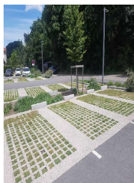
Parking de 59 places