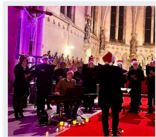
14 Décembre Choeur d'Esneval