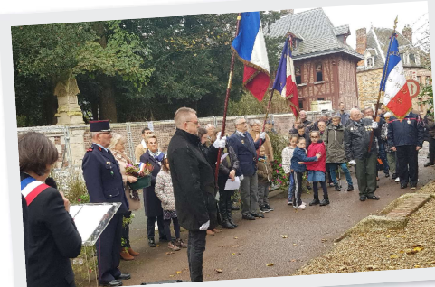
11 Novembre commémoration Armistice