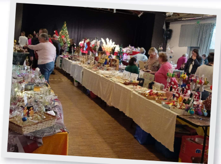
16 et 17 Novembre Trouvailles et douceurs