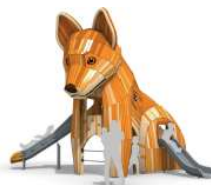
Aire de jeux enfants

Aujourd'hui, la consultation des entreprises pour la réalisation des travaux est prête à être lancée. Souhaitons que nos demandes de subventions aboutissent, condition indispensable pour que les deux premières phases voient le jour en 2025.