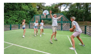
Aire de jeux ados: multisports et pumptrack