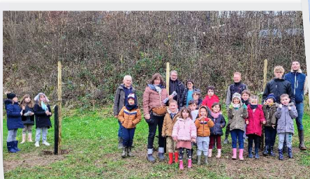
18 Décembre Plantation ENF