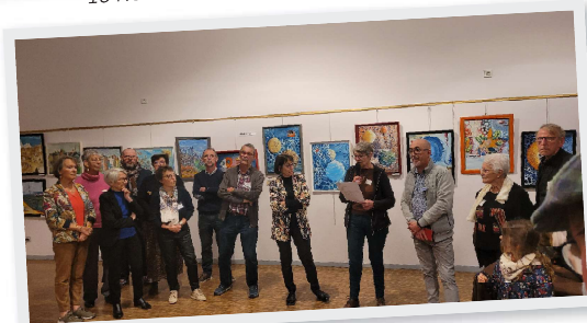
23 et 24 Novembre Expo peinture