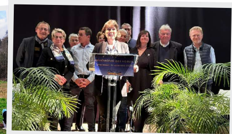
10 Janvier Vœux du maire