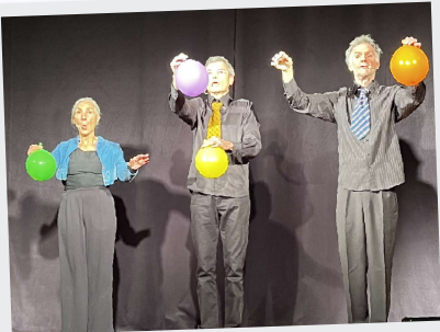
4 Octobre Chanson de poche