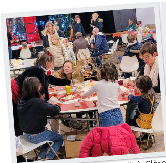
14 et 15 Décembre Un Noël à Clères