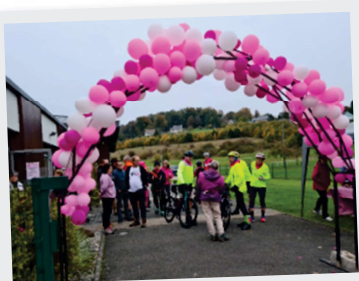
11 Octobre Octobre rose et remise du chèque