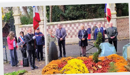
11 Novembre Commémoration armistice