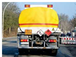
Transport matières dangereuses

Le PCS regroupe tous les documents contribuant à l'information préventive et assure la réponse opérationnelle, adaptée aux moyens de la commune, dans l'objectif de protéger et sauvegarder la population.