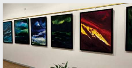
29 et 30 Novembre Exposition atelier cléris