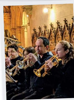
7 Décembre Concert brass band