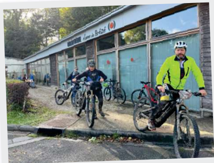
5 Octobre ARA VTT