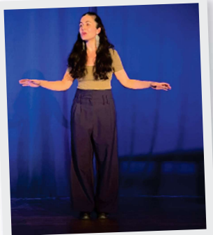
10 Octobre Festival du Conte