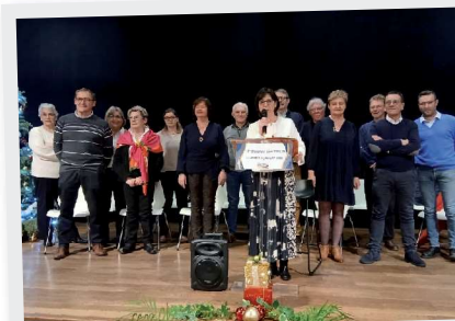
9 Janvier Vœux du maire