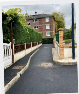
Octobre Voirie rue des Geais