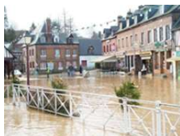
Clères le 26 décembre 1999