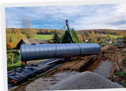
Novembre Pose citerne incendie au Tôl