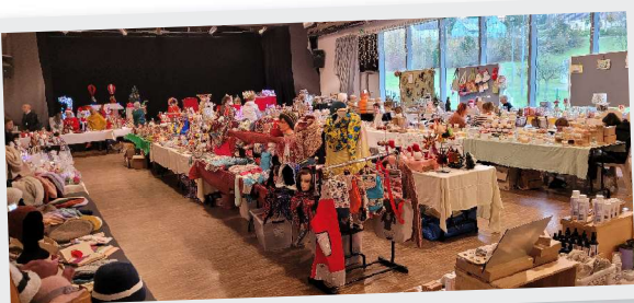
15 et 16 Novembre Trouvailles et douceurs