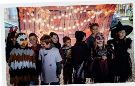
31 Octobre Halloween