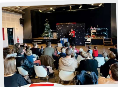
13 Décembre Noël à Clères