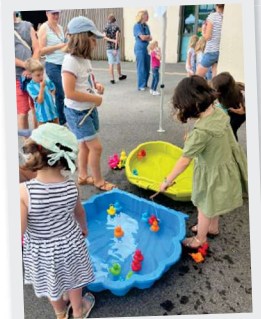
28 Juin Kermesse de l'école