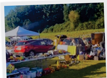
7 Septembre Foire à tout