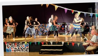
7 Juin Gala danse africaine