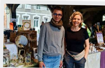
6 Juillet Marché de créateurs