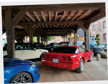
17 Mai, Les plus belles GT du siècle