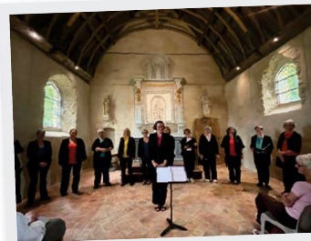
28 Juin Chœur de femmes « Dodécadames »