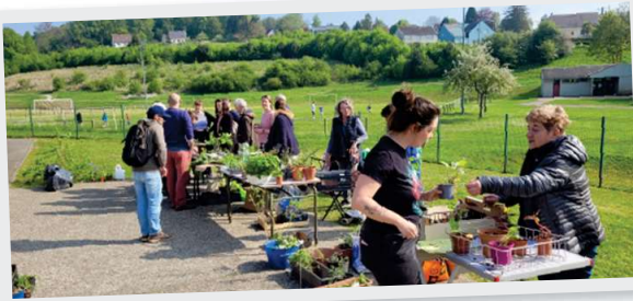
27 Avril Troc plantes