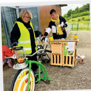
24 Mai Fête du vélo