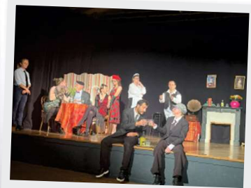
21 et 22 Juin Atelier Théâtre Foyer