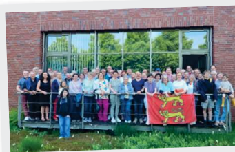
31 Mai Jumelage Goldenstedt