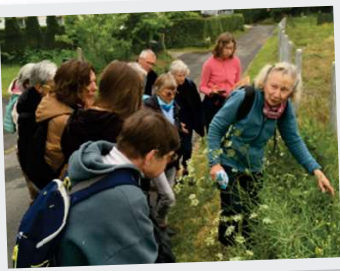
24 Mai, ENF Atelier plantes sauvages