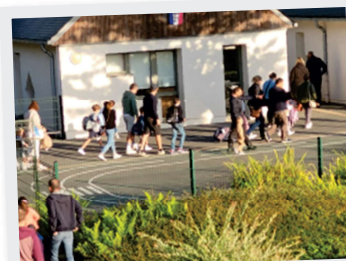
1er Septembre Rentrée des classes