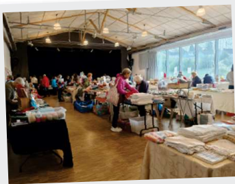
26 et 27 avril, Puces couturières et loisirs créatifs