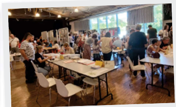
6 Septembre Forum des associations

Ouverture de la Mairie : Lundi 08:30 - 12:00 Mardi 08:30 - 12:00/13:30 - 19:00 Mercredi 08:30 - 12:00/13:30 - 17:30 Jeudi 08:30 - 12:00 Vendredi 08:30 - 12:00/13:30 - 17:30