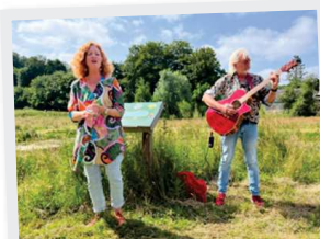
22 Juin ENF Déambulation contée